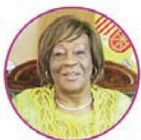
Excma. Sra. D.ª Purificación Angue Ondo Embajadora de Guinea Ecuatorial en España.